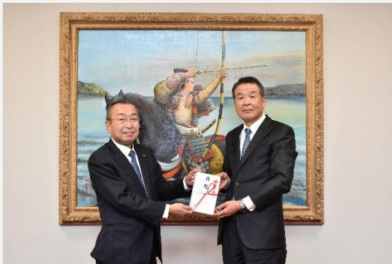
【だいしん文庫贈呈】