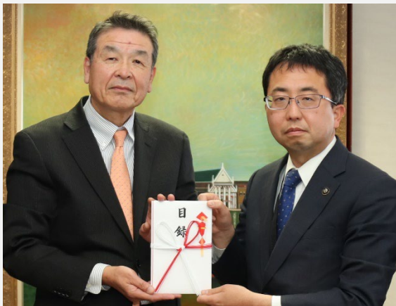
【だいしん文庫贈呈】