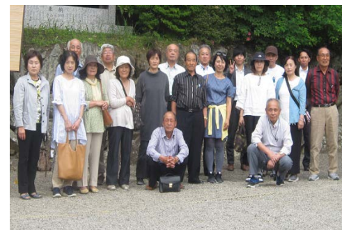
美原支店だいしん会日帰り旅行