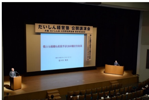
「だいしん経営塾」講演会