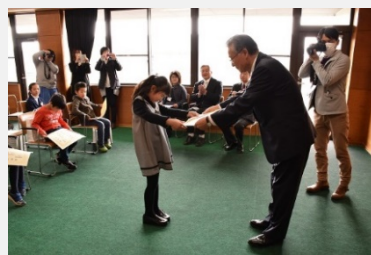
だいしん文庫読書感想文 コンクール表彰式