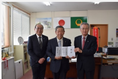
だいしん文庫贈呈

・平成20年度より、当金庫エリアの4市町の図書館に「だいしん文庫」として継続して寄付を行っています。10回目となる平成29年度は、4市町へ5百万円の寄付を行うとともに、4市町の小学1年から3年生を対象とした読書感想文コンクールを実施しました。