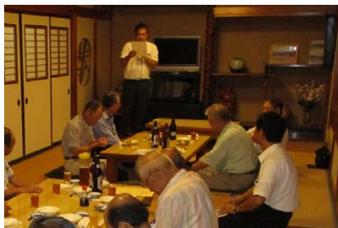
那須塩原支店だいしん会総会