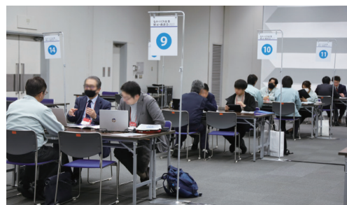
※過去開催時の様子